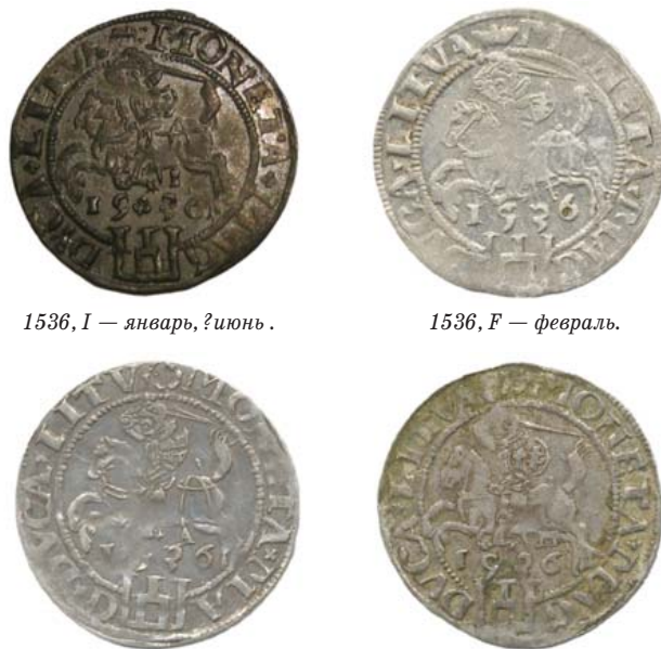
1536, I — январь, ?июнь.