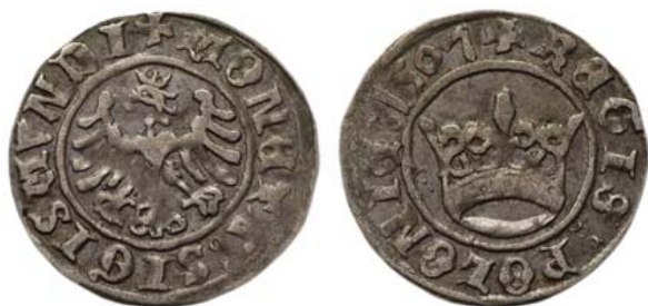
Жигимонт Старый, 1507 г.