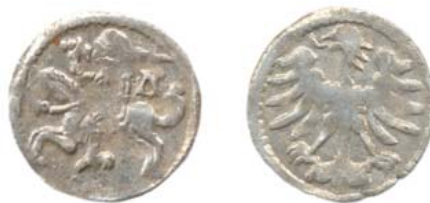
Денарий Вильно (аверс и реверс).

Еще одной причиной, ускорившей закрытие монетного двора в Вильно, могло стать уменьшение королевских доходов от чеканки монеты, в свою очередь обусловившее уменьшение поставок туда серебра. Об этом можно судить по меньшим, чем в предшествующие годы, тиражам чеканки литовских полугрошей в 1526—1529 гг. Скорее всего, серебро накапливалось в казне для открытия монетного двора в Торуне, который, по замыслу Жигимонта Старого, должен был стать главным монетным двором и чеканить общую монету. В результате Торунский монетный