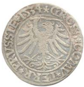
Грош 1534 г., Торунь (реверс).