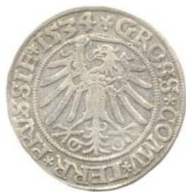
Грош 1534 г., Торунь (реверс).