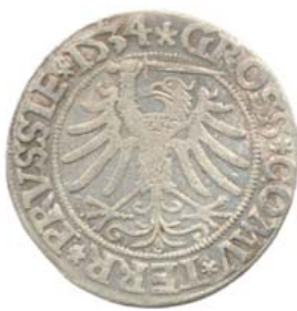
Грош 1534 г., Торунь (реверс).