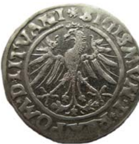
Грош 1535 г., Вильно (аверс).