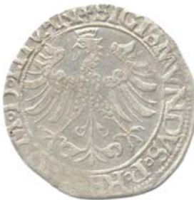
Грош 1535 г., Вильно (аверс).