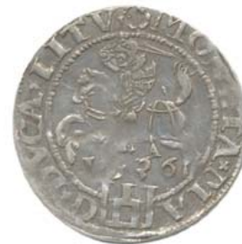
1536, A — апрель, ? август.