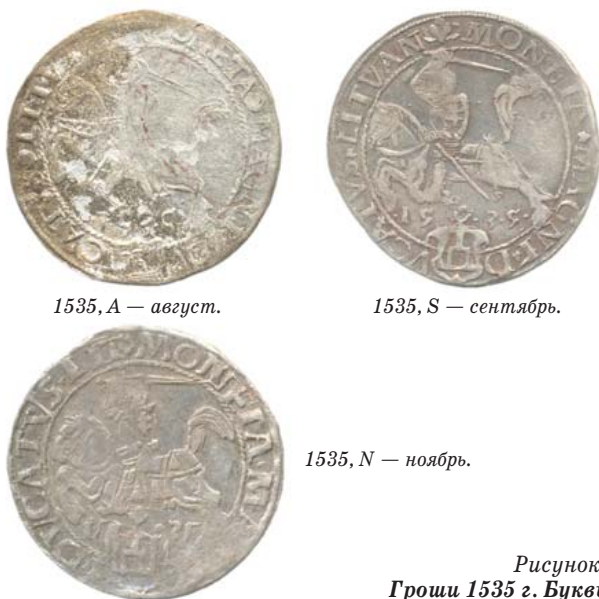
1535, А — август.