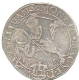
1535, S — сентябрь.