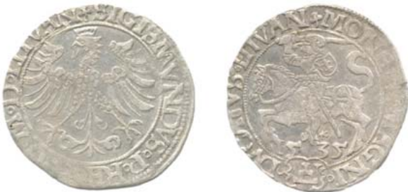
Грош 1535 г. (аверс и реверс).