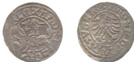
Полугрош Вильно (аверс и реверс).

Рисунок 1 Монеты Александра Ягеллончика.