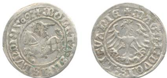
Полугрош 1509 г. (аверс и реверс).

Композиционно они очень похожи (рисунок 5) на ранее чеканившиеся полугроши, но теперь на аверсе появляются пястовский Орел и имя монарха, а на реверсе — литовская Погоня, под ней год и месяц чеканки, а внизу в составе легенды — герб “Колюмны”. Это