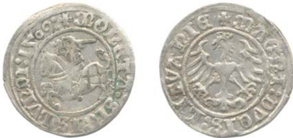
Полугрош 1509 г. (аверс и реверс).

Композиционно они очень похожи (рисунок 5) на ранее чеканившиеся полугроши, но теперь на аверсе появляются пястовский Орел и имя монарха, а на реверсе — литовская Погоня, под ней год и месяц чеканки, а внизу в составе легенды — герб “Колюмны”. Это