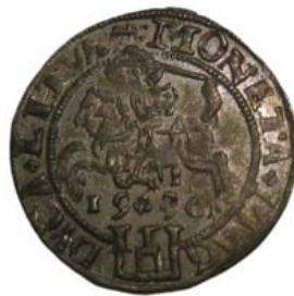
1536, I — январь, ? июнь.