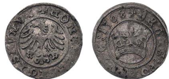
Жигимонт Старый, 1508 г.