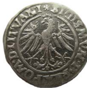
Грош 1535 г., Вильно (аверс).