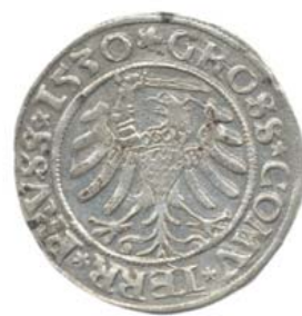
Грош 1530 г., Торунь (реверс).