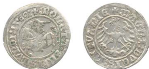
Полугрош 1509 г. (аверс и реверс).

Отсутствие архивных данных не позволяет установить точную дату открытия и подробности его работы. Известно, что в это время великим подскарбием (государственным казначеем) литовским был Иван Горноста́й, а управляющим монетным двором 17 августа 1535 г. назначен виленский епископ Иоанн, мюнцмейстером — Каспар Моллер. Сразу же по окончании боевых действий, скорее всего в июне 1536 г., монетный двор в Вильно был закрыт.