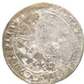
1535, А — август.