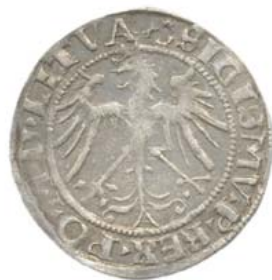
Грош 1536 г. (F), Вильно (аверс).