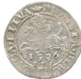
1536, F — февраль.