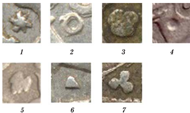
Рисунок 15 Знаки interpункции аверса и реверса.

Учитывая стилистические особенности в рисунках Погони и Орла в совокупности с остальными значимыми признаками, указанными выше, можно выделить шесть основных групп широких грошей 1535 г. с вариантами (рисунок 16).