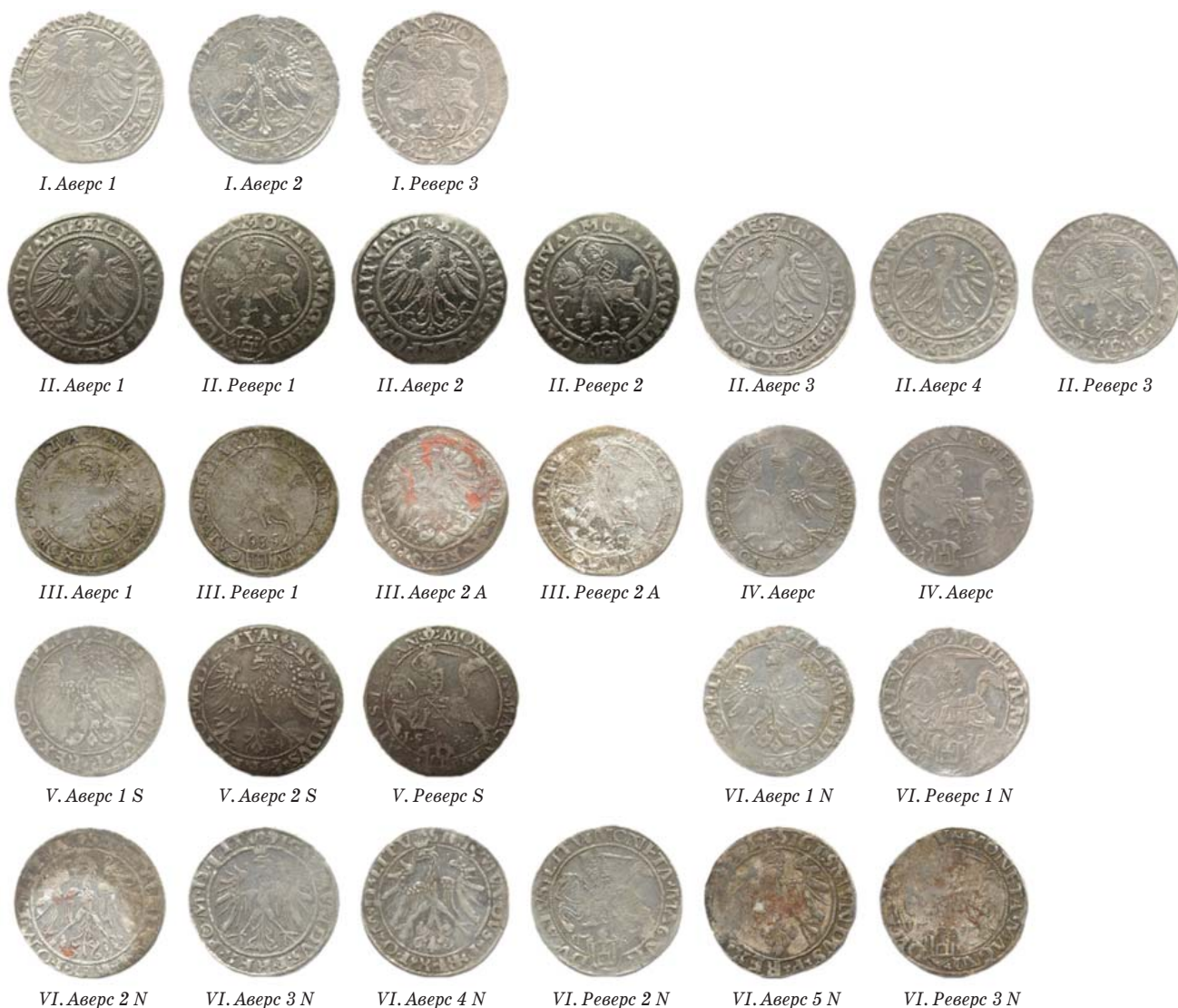
Рисунок 16 Гроши 1535 г.

Подводя итог, следует признать, что все еще остается очень много белых пятен в истории чеканки "широких" грошей по литовской стопе на Виленском монетном дворе в 1535—1536 гг., поэтому автор бу-