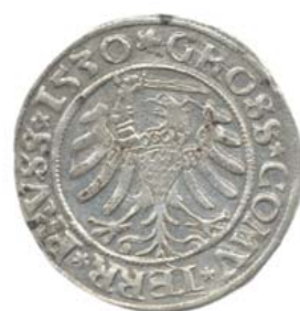
Грош 1530 г., Торунь (реверс).