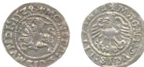
Полугрош 1524 г. (аверс и реверс).