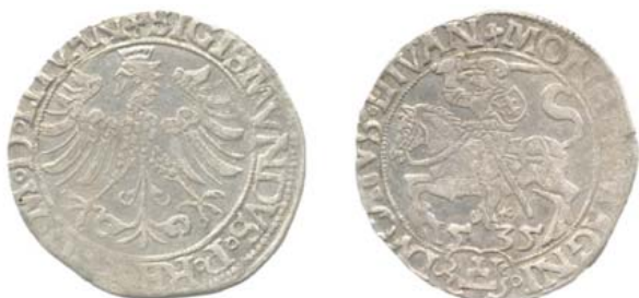
Грош 1535 г. (аверс и реверс).