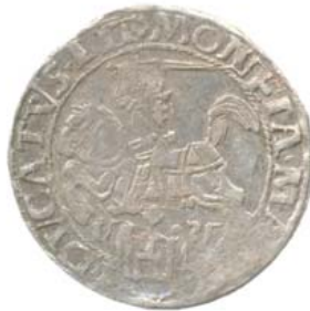
1535, N — ноябрь.