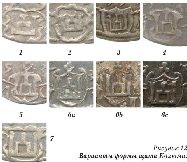
Рисунок 12 Варианты формы щита Колюмн.