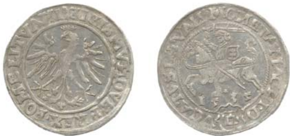
Грош 1535 г. (аверс и реверс).