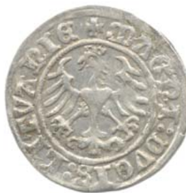
Полугрош 1509 г., Вильно (реверс).