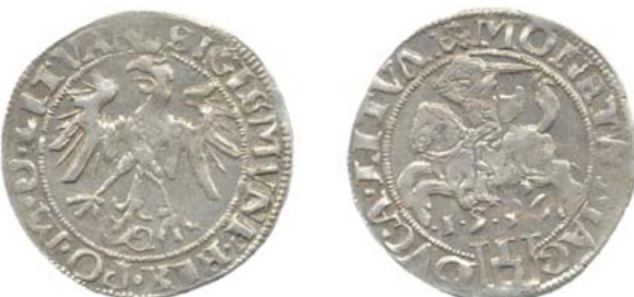
Грош 1536 г. (I) (аверс и реверс).