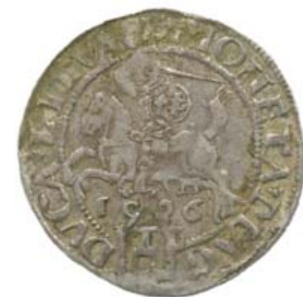
1536, M — март, ? май.