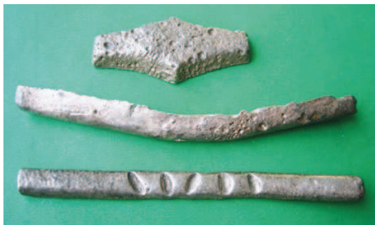
Рис. 2. Гривны киевская, новгородская и литовская из Вицинского клада 1979 г.