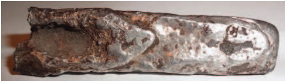
Рис. 12. Полтина с клеймом „звезда“

Самое первое, найденное автором, упоминание о клеймении серебряных слитков относится к 1274 г., когда в своем дипломе Великий магистр Ордена крестоносцев требует, чтобы «... переплавленное серебро каждый... клеймил своим знаком...» [31, с. 11]. Таким образом, клеймить слитки могли, вероятно, в Ливонии и Пруссии, а также, возможно, и в ВКЛ. Однако на сегодняшний день точное место и время клеймения «не-русскими» клеймами определить достаточно сложно. До последнего времени все известные комплексы с клейменными слитками, найденные в Беларуси, не содержали монет, данные о находках клейменных слитков в Литве отсутствуют, а данные о находках в Украине 5 – требуют уточнения.