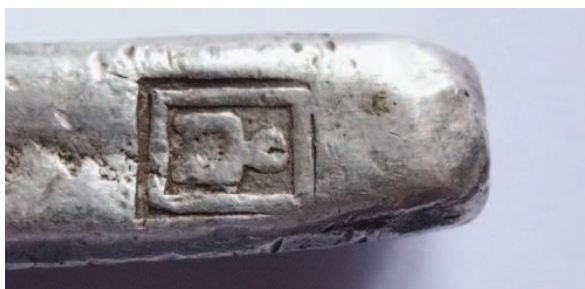
Рис. 14. Клеймо „геральдический знак/ татарская тамга ?” в квадратной рамке

Не ранее 2000 г. в дер. Княжицы (Княжыцы) около Могилева были найдены полтины с литой стрелкой на боковой поверхности и слегка прокованной спинкой [23]. Вес известных полтин – 90,3; 91,3; 93,9; 95,2; 97,3; 99,9 г. Часть слитков была с надчеканками: корона, звезда, скрещенные ключи с крестом, все в связанном точечном ободке (Рис.11 а, b).