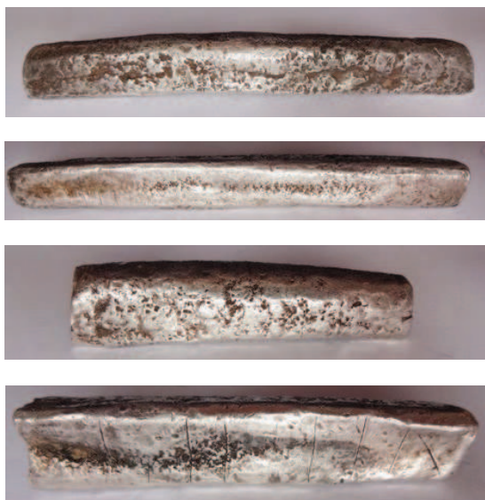
Рис. 3. Новгородские рубль (а, б) и полтина (с, д), начало XIV - 1 пол. XV в.