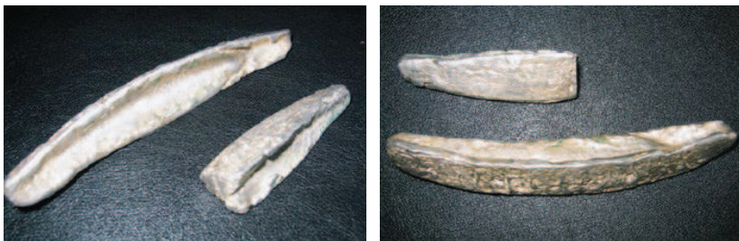
Рис. 4. Литовская трехгранная гривна и полтина, посл. четв. XIV-3 четв. XV в.

по схожей технологии, скорее всего в открытые формы, вследствие чего они имеют очень похожую, характерную изрытую поверхность. Основное внешнее отличие большинства литовских «трехгранных» слитков в том, что они имеют более изрытую поверхность с большим количеством каверн. Кроме этого у них больший изгиб, и они немного выше новгородских слитков. У литовских слитков верхняя грань – острая, а у новгородских – эта грань более сглажена, а ее концы обработаны после литья напильником или прокованы. Ни один, из исследованных автором экземпляров литовских «трехгранных» рублей и полтин, не имеет признаков двойного литья и продольного шва, что в совокупности с выраженным желобком и рисунком «волны» на верхней поверхности позволяет предположить, что они отливались за один прием. Возможно, это является их принципиальным технологическим отличием от «горбатых» новгородских слитков.