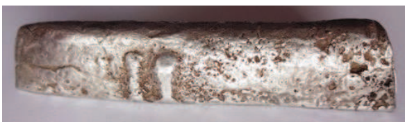
Рис. 9. Выпуклый литой знак – две поперечные параллельные короткие линии на полтине