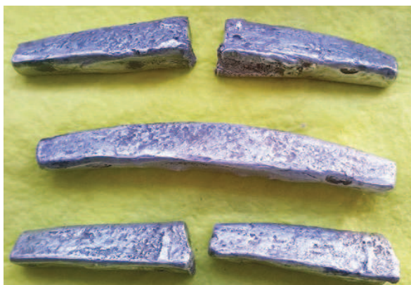
Рис. 13. Рубль и полтины из Мстиславского р-на Могилевской обл., 2014 г.