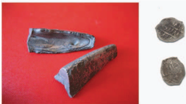
Рис. 5. Полтины и подражание монете Джанибека, р. Ирпень под Киевом, 2002 г.

В 2002 г. на старом селище на берегу реки Ирпень под Киевом (Украина) были найдены две «трехгранные» полтины весом 96,88 и 99,51 г. (Рис. 5), одна из