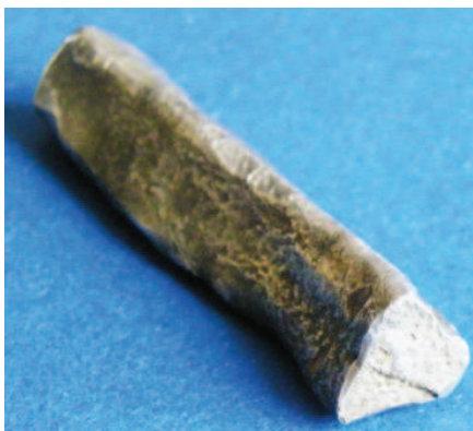
Рис. 7. Региональный вариант новгородской полтины, Ошмянский р-н Гродненской обл., 2011 г.

В 2011 г. в Ошмянском р-не, Гродненская обл. (Беларусь) была найдена треугольная в сечении полтина (Рис.7а, б) весом 87,59 г с прокованным концом [20, с. 209]. Это еще один региональный вариант новгородской полтины, найденной в центральной части ВКЛ.