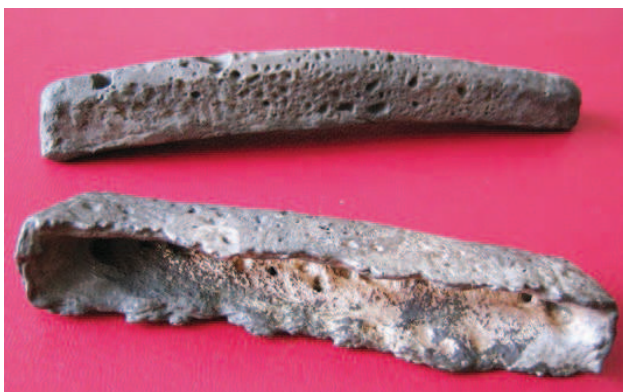
Рис. 6. Татарский „сам“ и новгородский „горбатый“ рубль из Кобринского клада 2003 г.

которых по внешнему виду больше похожа на литовскую, чем новгородскую [18]. По весу их тоже стоит скорее отнести к новгородским. Рядом с ними была найдена маленькая монетка весом 0,17 г, являющаяся «киевским» подражанием серебряной монете Джанибека, чеканившейся в Гюлистане в 1352-1353 гг. Время чеканки таких подражаний, по мнению Хромова К.К., может быть определено между 1354 и 1363 гг. [15, с. 88]. На полтине с необработанным острым ребром, на внутренней стороне есть процарапанное графитти в виде стрелки. Можно предположить, что эти платежные слитки были изготовлены не ранее середины XIV в., а местом их