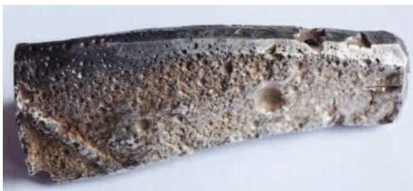
Рис. 8. Выпуклый литой знак – стрелка (фрагмент) на полтине с прокованной спинкой