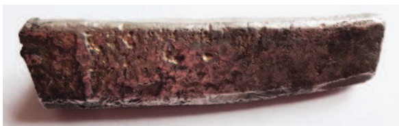
Рис. 10. Выпуклый литой знак – одна короткая линия на полтине

Рубли и полтины новгородского типа клеймились в русских княжествах и землях. 4 Одной из целей клеймения, скорее всего, было придание рубленным пополам серебряным слиткам, незначительно отличавшимся по весу друг от друга, статуса узаконенного платежного средства, имевшего определенную стоимость. По всей видимости, вначале полтины в месте разруба и на спинке помечались с помощью граффити, чтобы уменьшить возможность обрезания металла, а потом их начали клеймить.