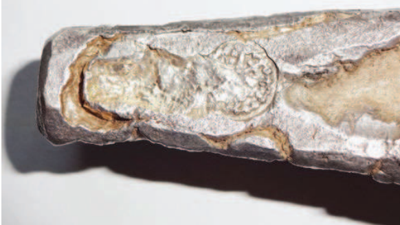
Рис. 11. Полтины с клеймами: а – „корона“; б – „скрещенные ключи с крестом“