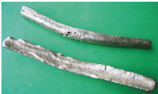
Рис. 1. Гривна новгородская длинная, XII – XIII вв.